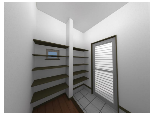
1階サービスクローク